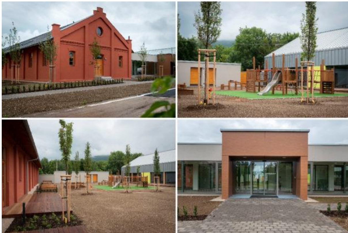
OBRÁZOK 3: Budova a areál novej materskej školy na Martinskom vrchu, Nitra, Slovensko.

V súčasnosti časť areálu slúži denne pre účely materskej školy (obr. 3) a časť areálu býva sprístupnená z bezpečnostných dôvodov (pokračujúca rekonštrukcia objektov, prestarnuté stromy...) pre realizáciu špecifických aktivít uvedených nižšie.