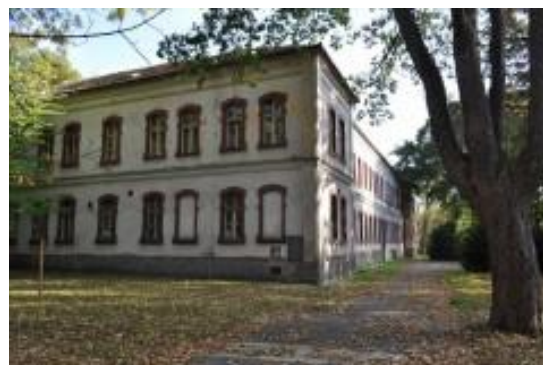
OBRÁZOK 2: Budova kasární na Martinskom vrchu, Nitra, Slovensko.