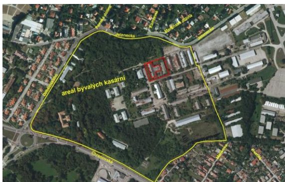
OBRÁZOK 1: Areál bývalých kasární na Martinskom vrchu, Nitra, Slovensko.

Vo veľkomoravskej časti archeoparku sa prezentujú 4 štyri zemnice, z toho tri so zrubovou nadzemnou konštrukciou a jedna s kolovou konštrukciou a tzv. vyplietanými a hlinou obmazanými stenami. Ďalším obnoveným objektom je samostatne stojaca hlinená kupolová chlebová pec s predpecnou jamou.