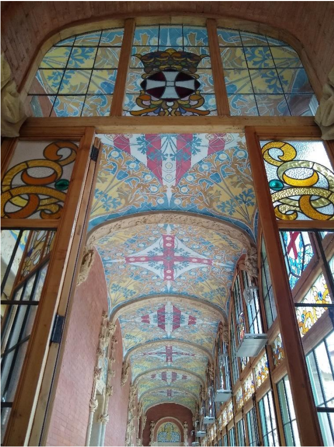
FIGURA 4: SANT PAU RECINTO MODERNISTA.