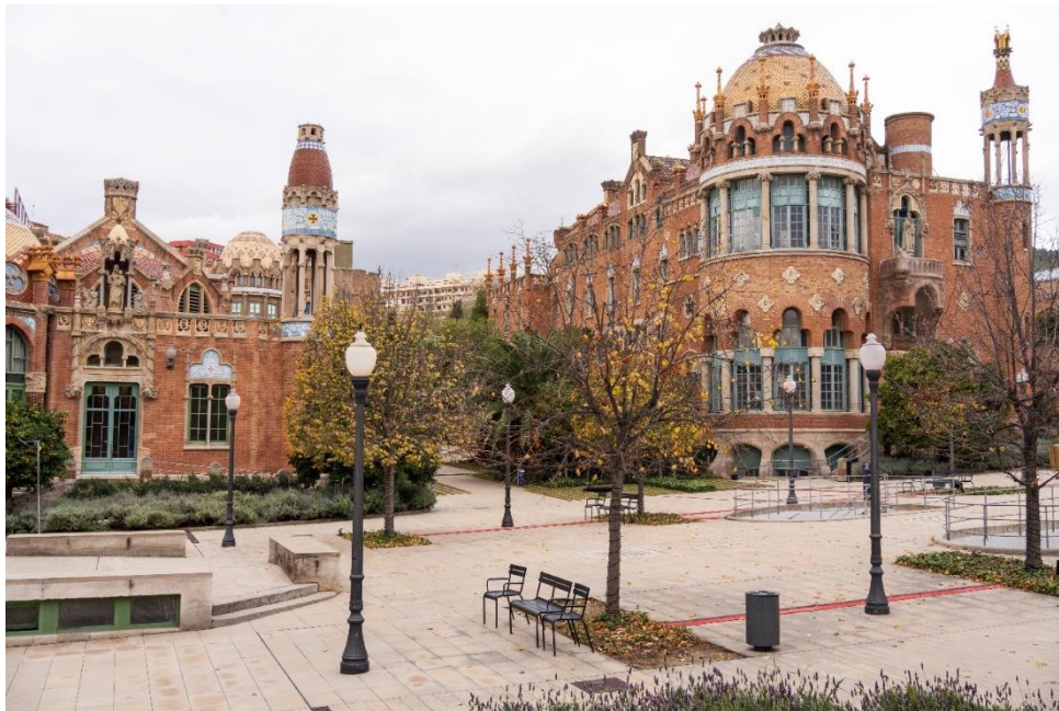
FIGURA 2: SANT PAU RECINTO MODERNISTA.

El Recinto Modernista de Sant Pau constituye un ejemplo convincente de cómo estos lugares pueden respetar a los residentes locales y mejorar el compromiso con la comunidad sin dejar de generar beneficios económicos a través del turismo.